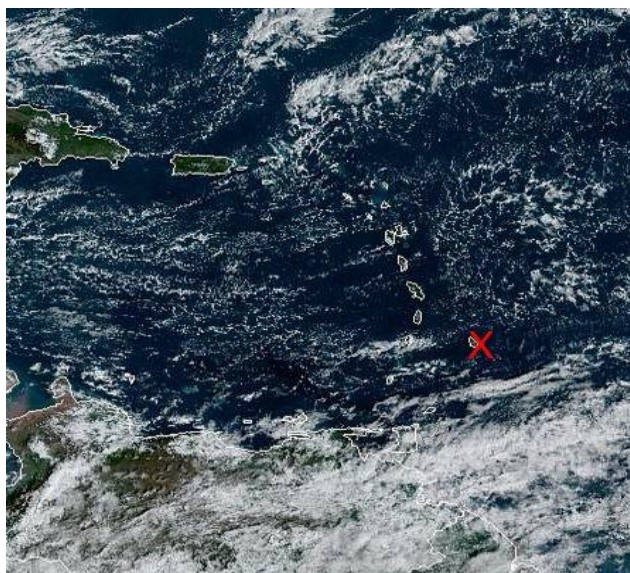
Satellitenbild GOES 16.01.2020 13:00 UTC

Ost bis Nordost 4 bis 5 Bft, zunehmend 5 bis 6 Bft und auf Nordost drehend, Regenschauer, sonst gute Sicht, See mit Dünung um 2,5 Meter.