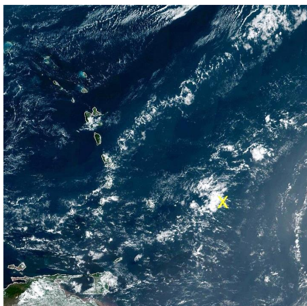
Satellitenbild GOES16 31.01.2020 13:20 UTC

östlicher Wind 3 bis 4 Bft, einzelne Schauer, sonst gute Sicht, See mit Dünung 2 m, Dünung aus Nordost bis Nord