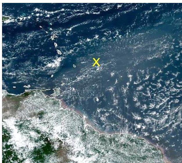
Satellitenbild GOES16 01.02.2020 13:20 UTC

Ost bis Nordost 4 bis 5 Bft, einzelne Schauer, sonst gute Sicht, See mit Dünung 2 m, Dünung aus Nordost bis Nord